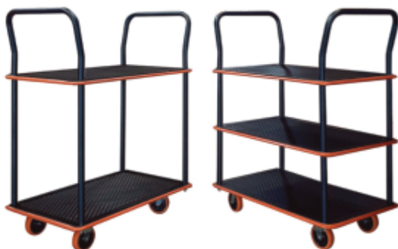
1 Chariot 2 plateaux